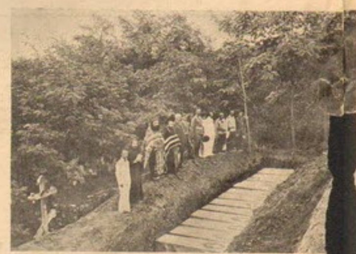
Погребеніе останковъ воиновъ въ Дальнемъ, куда они перевосены изъ Талиенвана.