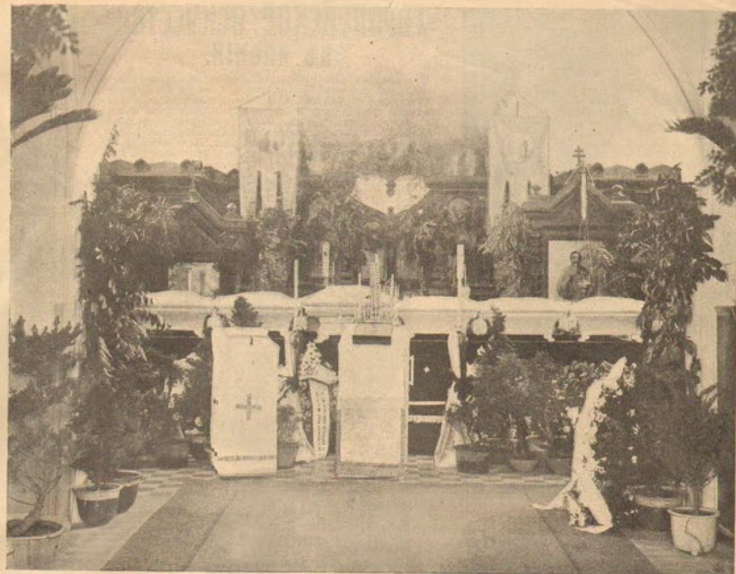
Останки офицеровъ въ церкви гор. Дальнаго, куда они были привезены на П.-Артуръ для отпаванія и потомъ обратно возвращены въ П.-Артуръ для погребенія.

Какъ известно, благодаря выполненным работам броненосца «Петропавловскъ», который лежалъ на глубинѣ 20 сажень, нить труповъ офицеровъ и между прочимъ, трупъ адмирала Меласа. Погребеніе 24 іюня въ присутствіи вице-адмирала Яковлева, командовавшаго «Петропавловскомъ» при его гибели. Адмиралъ былъ спасенъ въ числѣ 8 офицеровъ и 70 нижнихъ чиновъ. Тогда же погибъ въ пути на Портъ-Артуръ адмиралъ Яковлевъ. Онъ объѣхалъ многія мѣста, гдѣ находились могилы нашихъ героевъ, погибшихъ въ русско-японскую войну и при возвращеніи въ Петербургъ сдѣлалъ подробный докладъ.