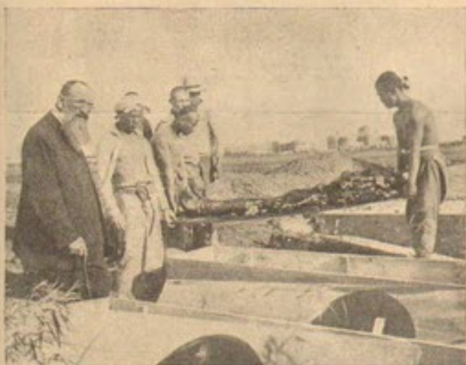
Перевосеніе останковъ со стараго на новое кладбище въ Муженгѣ.