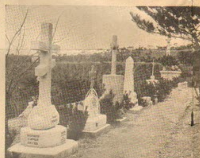
Кладбище въ Талиенванѣ.