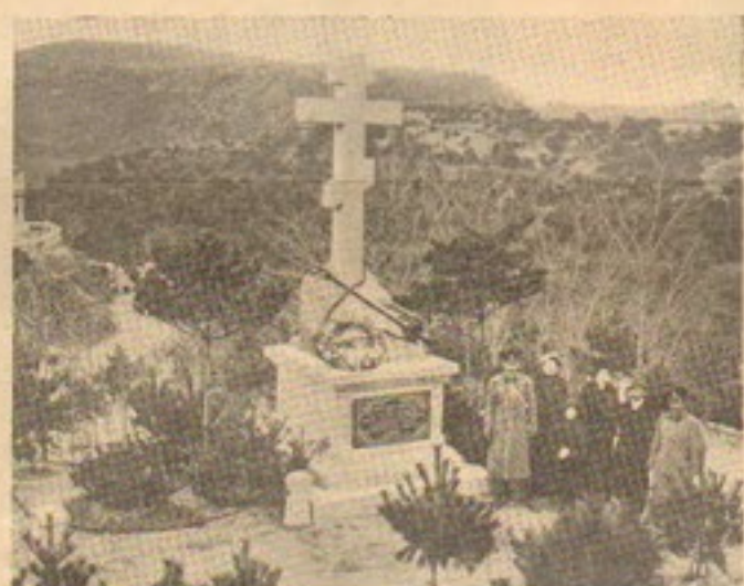
Памятникъ погибшимъ морякамъ транспорта «Енисей».