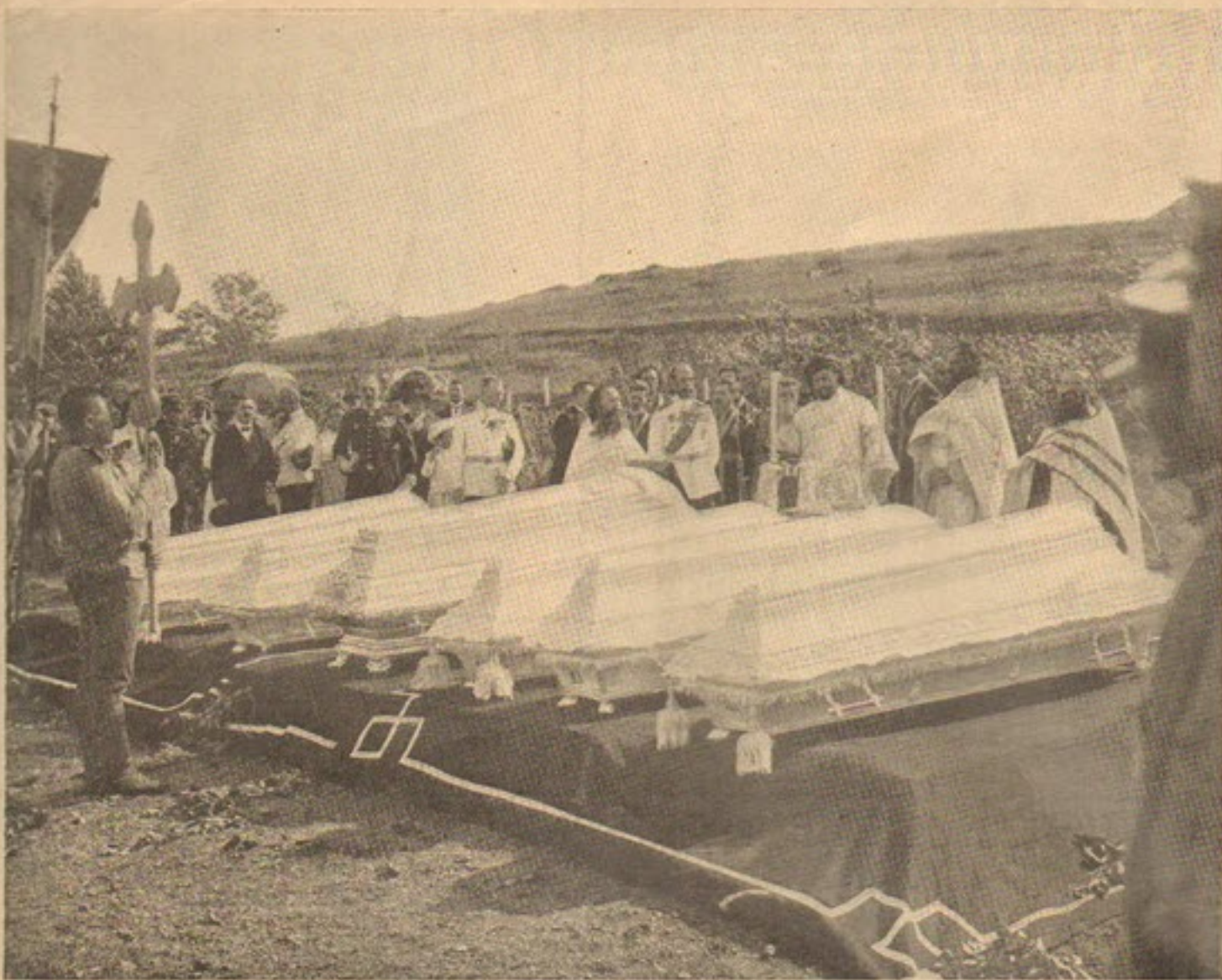
Погребеніе останковъ офицеровъ, извлеченныхъ изъ каютъ «Петропавловска».