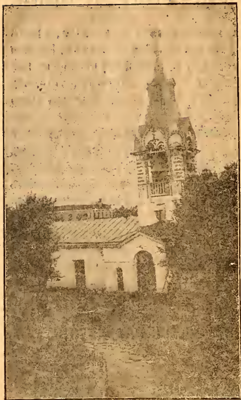
Колокольня - входъ въ церковь.

Наводненіе началось въ подворьѣ 28 іюля—10 августа. Къ 1/14 сентября вода сошла съ поверхности двора, но осталась въ подвалахъ.